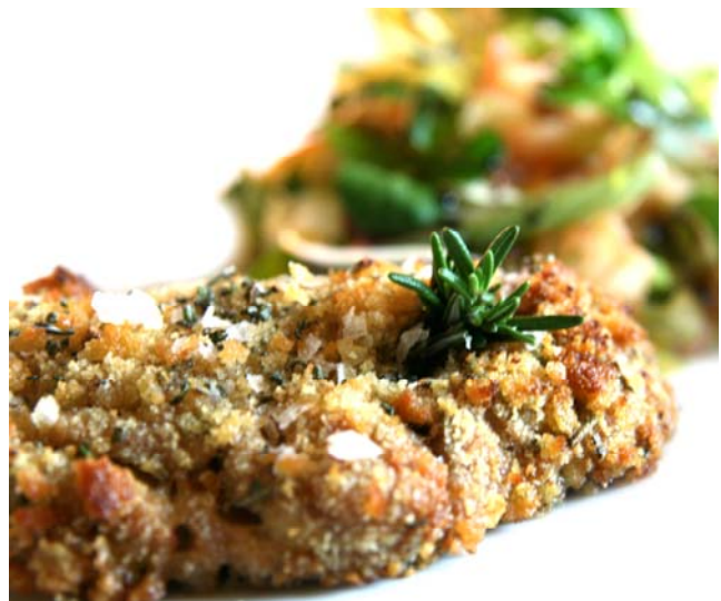
^ Fotografia ed elaborazione grafica: MariaLuisa Basile

"L'uomo si scopre e s'inventa parlando" scriveva Corrado Alvaro. È l'attore? È meglio recitare a soggetto o seguendo un canovaccio preciso? Il cervellotico interrogativo posto dalla pirandelliana opera Questa sera si recita a soggetto proposta dal 18 gennaio al 6 febbraio 2011 al Teatro Cavallerizza Reale di Torino è risolto per Assaggi di Teatro dallo chef Alfredo Russo con una... cervella, frattaglia spiazzante per delicatezza di sapore e morbida consistenza. Sapori evocati con parole e immagini sul sito www.assaggiditeatro.it